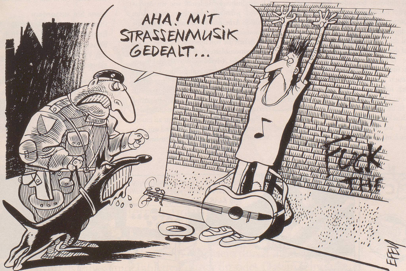
Jagdscene aus Zürich: Nach der Drogenszene wird nun auch die Strassenmusikszenen aufgelöst ...