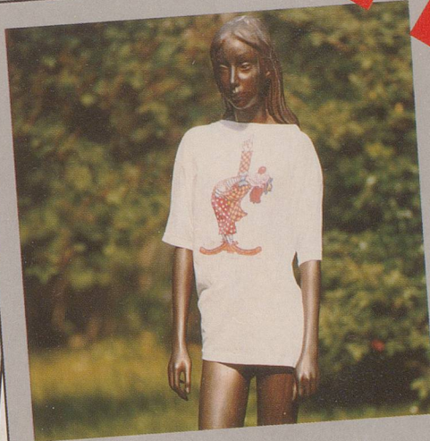
..für eiserne Ladys...