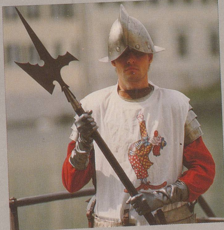
...und rüstige Herren ...