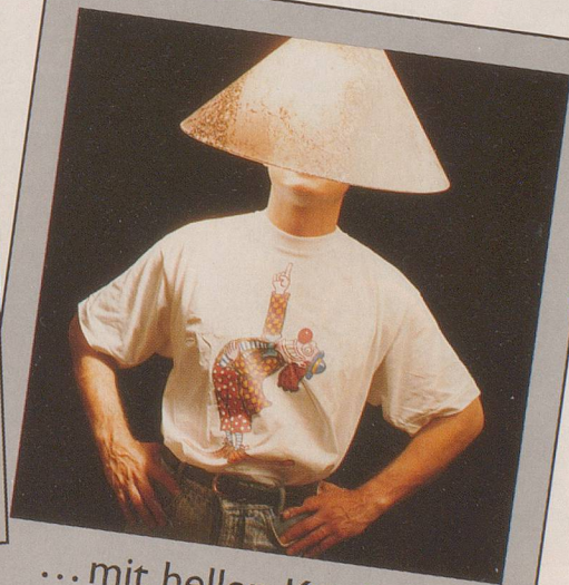
...mit hellen Köpfen.