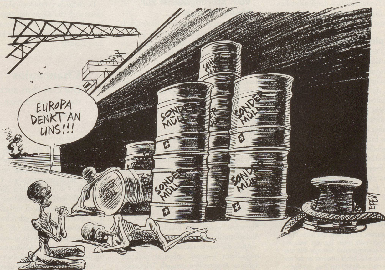
Die Schweizer Firma Achair Partners plante Sondermüllexporte ins Bürgerkriegsland Somalia: 5000 Tonnen jährlich waren ausgemacht ...