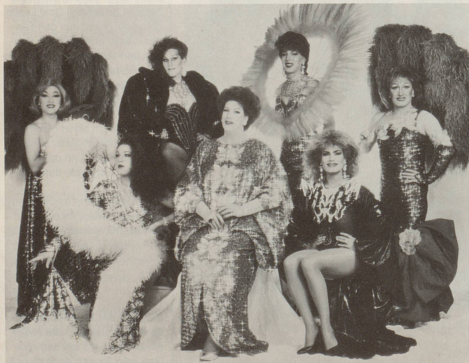
14 Jahre und immer noch derselbe Glitzer: Das Berliner «Cabaret chez nous» zeigt Bein und Brusthaare.