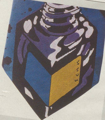
...in die Tinte setzen würden.