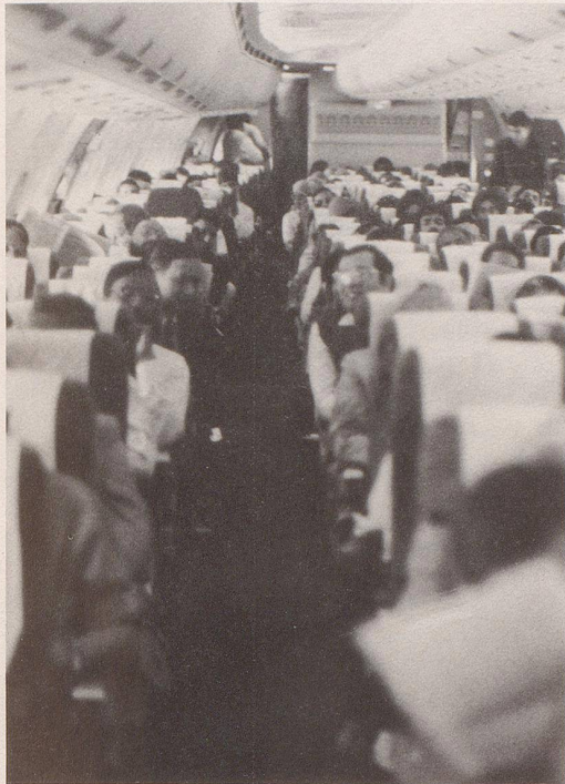
5 ... den Reisekomfort.