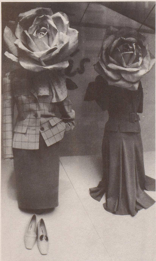
6 Charmante Hostessen kümmern sich ganz speziell ...