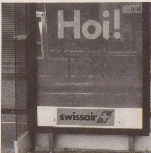
9 ... und ein besonders heimeliger Umgangston.