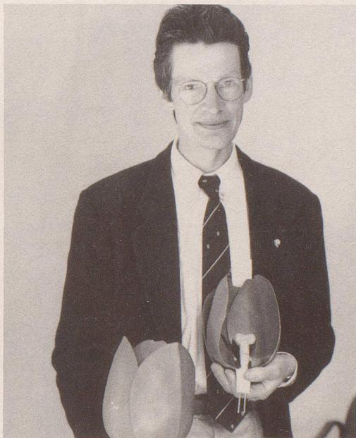
8 Neu bei der Swissair sind Blumen für die Damen ...