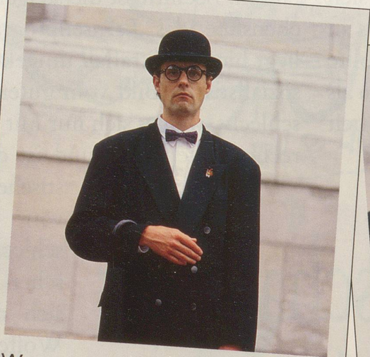
Wenn auch Sie zu den Leuten gehören möchten ...

In einer tierisch ernstesten Zeit, ein satirisch heiterer Pin.