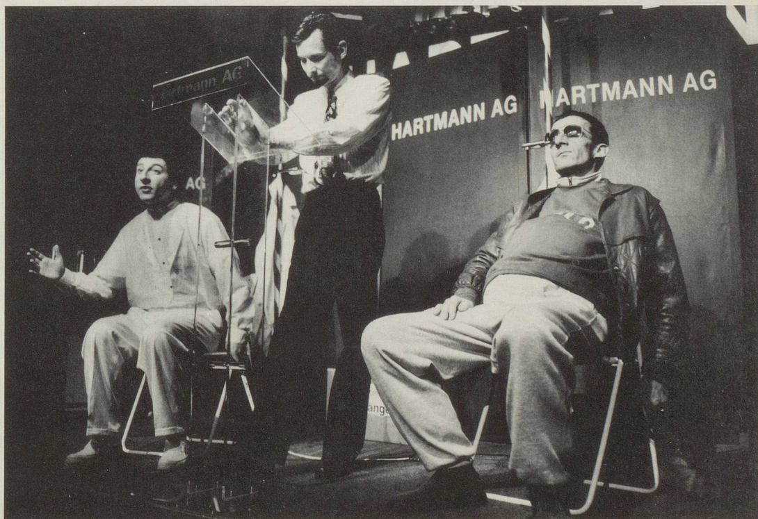
Höhepunkt des Abends: Beat Schlatter als tuntiger Gastro-Designer, Patrick Frey als kantiger Rechtsausser.