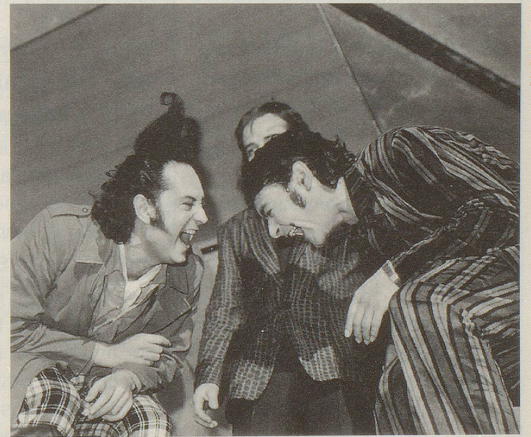
... in der Krimiparodie Hobbycop.

Es hebt ein Spiel an, das die Macker-Allüren der klassischen Kriminalgeschichten aufs Korn nimmt und die «Gspürschmi»-Stimmung der Cliché-WG veräppelt. Lustvoll karikieren die Schauspielerinnen und Schauspieler ihre Vorlagen in einem faszinierenden Bühnenbild, wo auf einer Ebene die Detektei