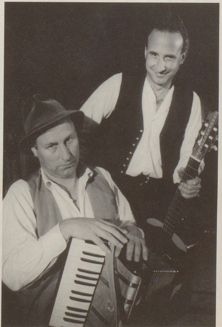
Mehlprimeln: Volksmusik muss nicht volksdummlich sein.

sind vor allem seine Figuren. Ob besoffener Oberleutnant, exaltierter Selbstfindungsheini oder schrulliger Prostataageplagter – immer lässt Schramm sein Publikum vergessen, dass hier bloss gespielt wird. Er imitiert die verschiedenen Personen nicht nur treffend, sondern lebt sie geradezu. So wird aus dem Ein-Mann-Kabarett ein temporeiches Mehr-Personen-Stück, wenn Schramm im zweiten Teil aufdreht. Um einen runden Tisch versammelt er alle seine Figuren und schlüpft pausenlos von der einen in die andere