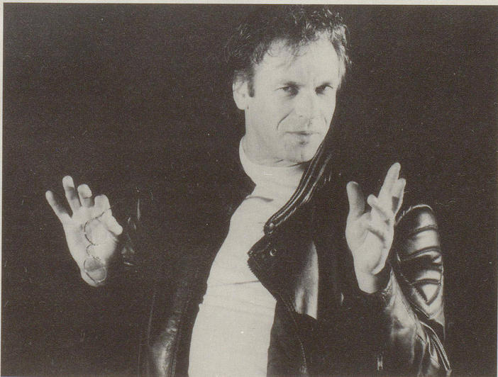
Georg Schramm: bissiges und unterhaltsames Kabarett