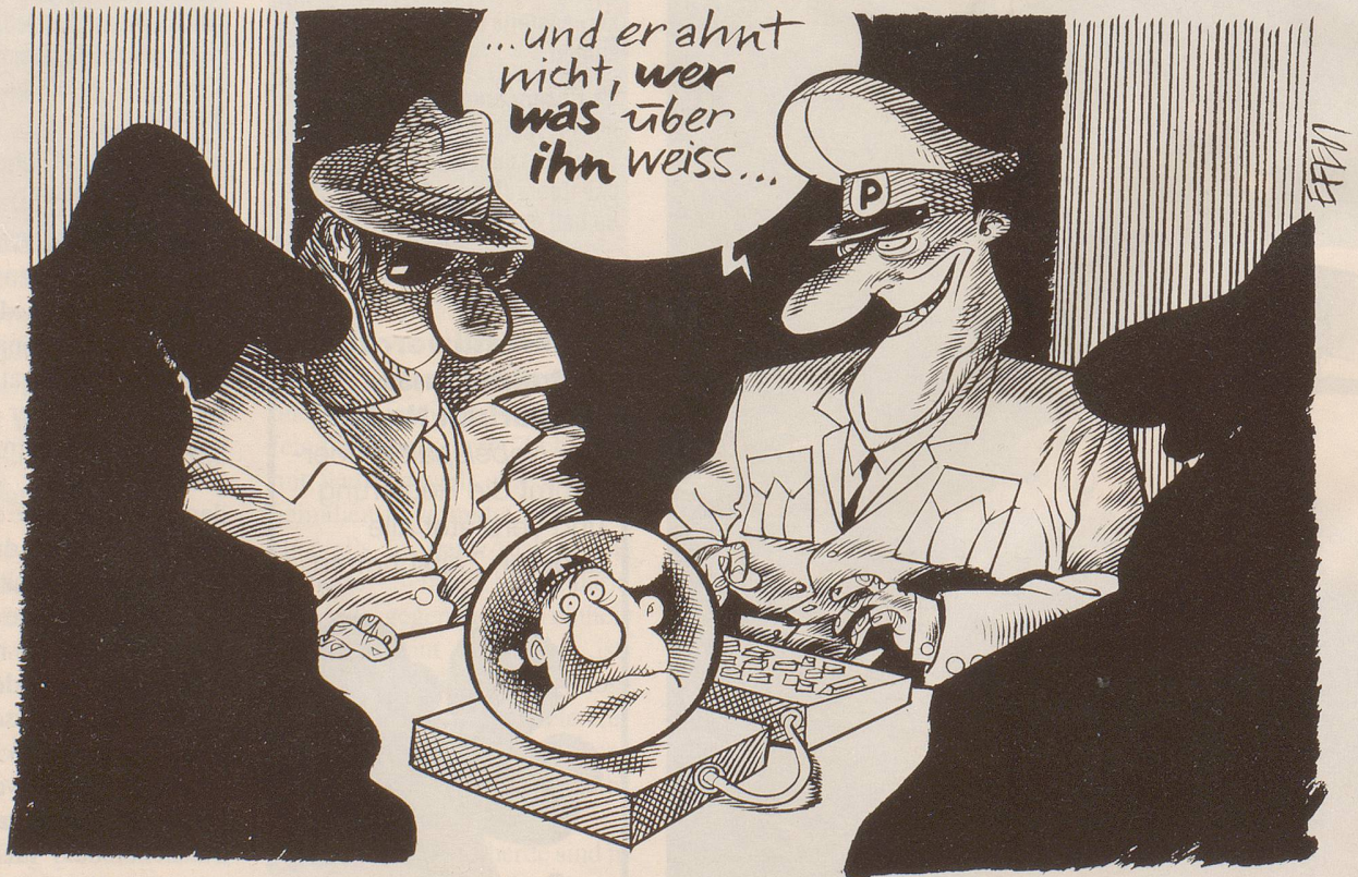
Odilo von Guntern warnt vor einer Aushöhlung des Persönlichkeitsschutzes durch das Vernetzen von Polizei- und Bürokratierechnersystemen.