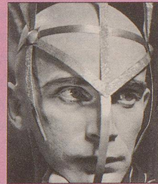
Muesli-Massage-Maske von Dr. Bircher