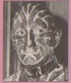
Revitalisierungsmaske von «Schlauer Bauer»

Schönheitsmasken sind für Männer kein Muss, aber ein Kann, Darf und Soll. Immer mehr Typen leisten sich den Luxus einer Schönheitsmaske, denn so entspannt, sauber und frisch gestählt für die nächste Runde Weizenbier mit «Sprutz» fühlt sich Mann sonst nur nach einem Besuch im Bordell. Die geilsten Masken möchten wir Ihnen hier im Bild vorstellen.