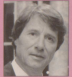
Einfach 1 saublöde Maske