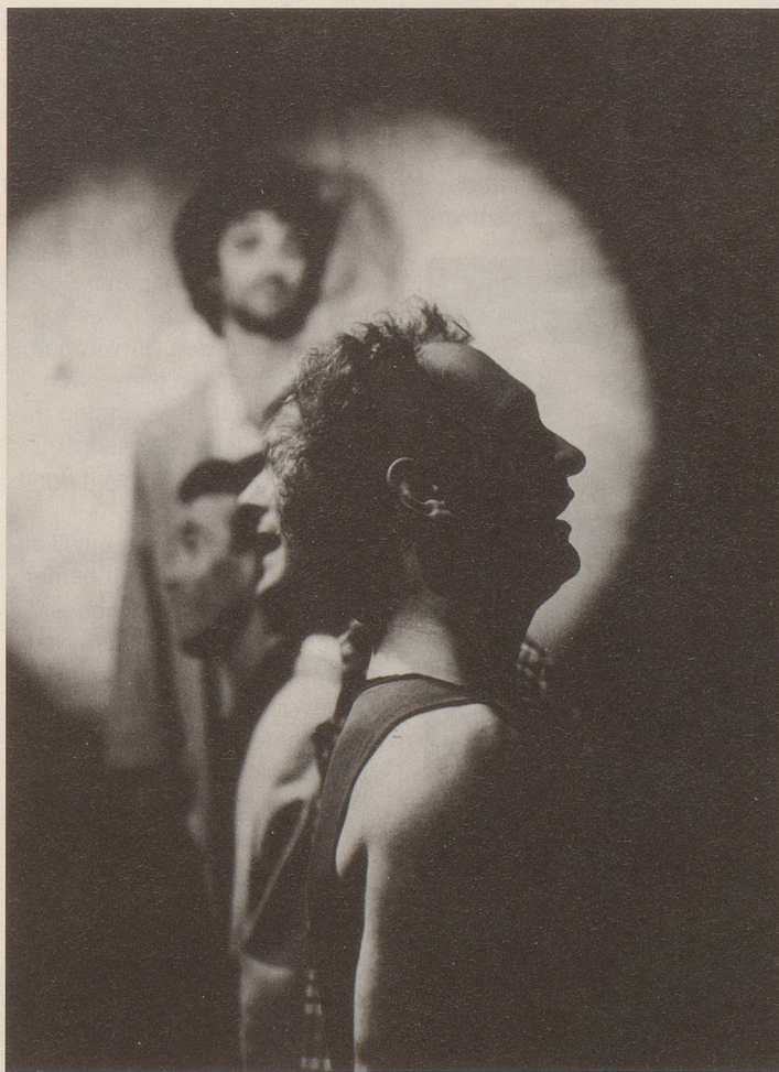
Guter Sound, perfekt inszeniert: Pfannenstil Chammer Sexdeet

Ob musikalisch oder textlich, die fünf sympathischen Kerle vom Pfannenstil überzeugen durch Witz – durch geistreichen Notabene –, durch musikalische Qualitäten, die sich hören lassen können, und durch eine hinreissende und gewinnende Verspieltheit.