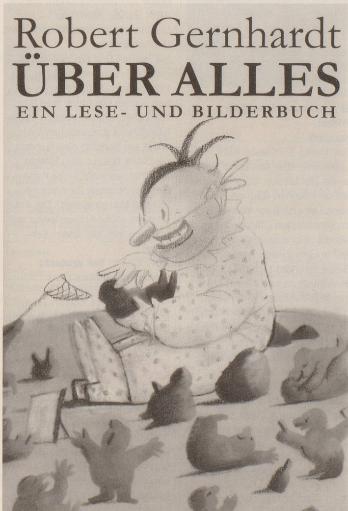
«Über alles» von Robert Gernhardt, erschienen im Haffmans Verlag, Zürich (1994).