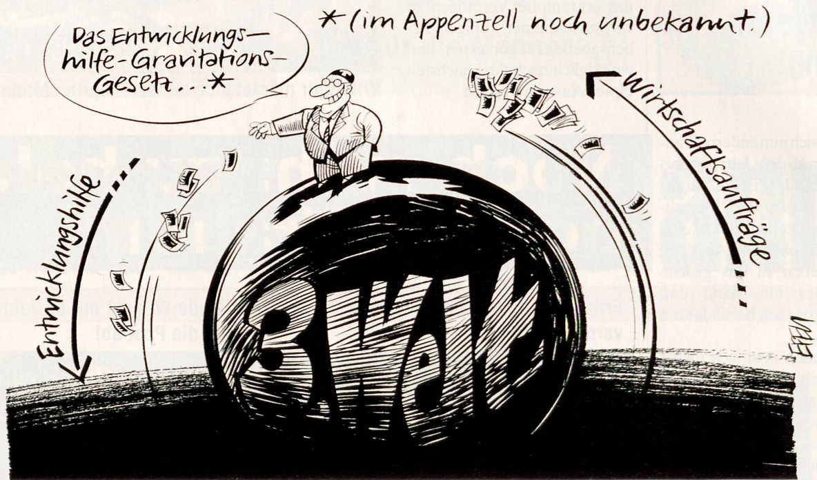
Carlo Schmid (Appenzell) möchte den Entwicklungshilfe-Kredit um 200 Millionen kürzen.