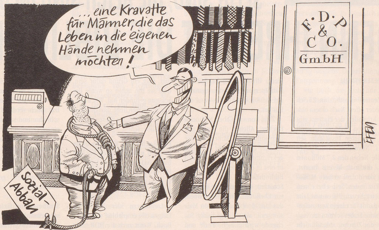
La cravate américaine (wird hierzulande Mode!)