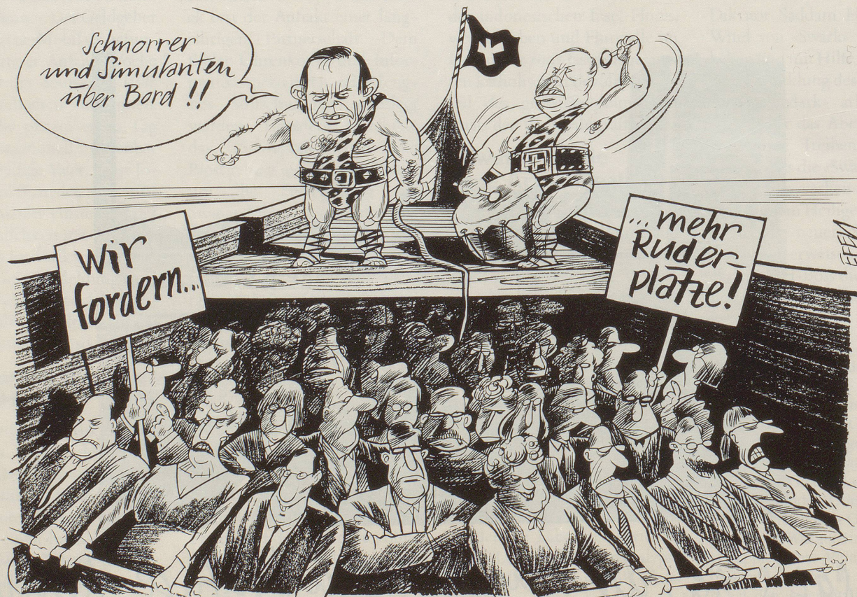
Bürgerliche Tonangeber und Einpeitscher ...