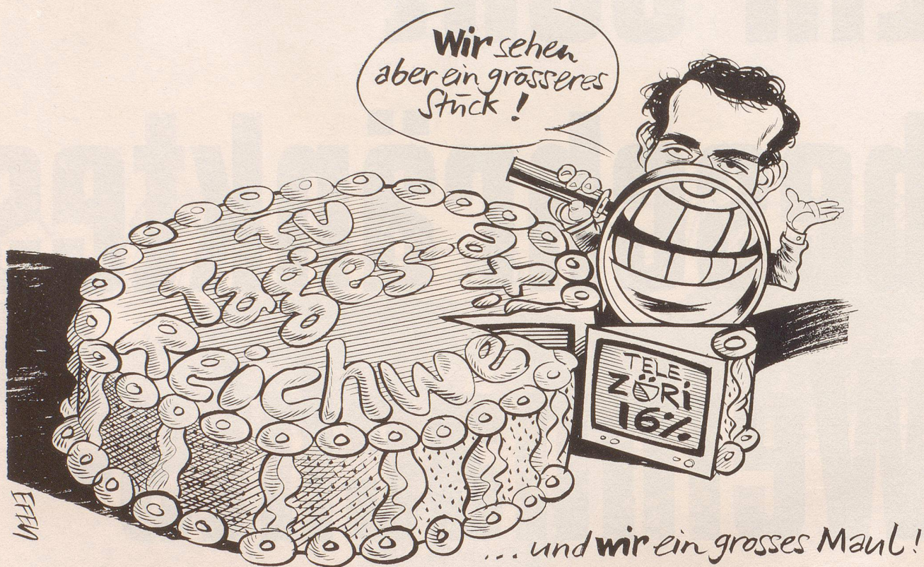
Roger Schawinsky muss sich damit abfinden: Tele Züri hat nicht mehr ZuschauerInnen als S Plus!