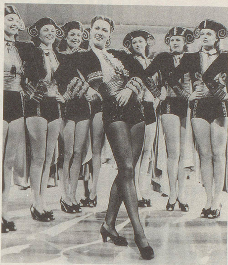
Ist das Boot schon voll?

Mitarbeiter dieser Nummer: Constantin Seibt (cos), Christoph Schuler (sch), Eugen Fleckenstein (Flecken), Catering by Jargon und Reklame