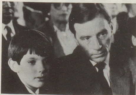
Roadster SL und sein kleiner Bruder (v.l.n.r.)

1997 erscheint der kleinere Bruder des Roadsters SL, der SLK, mit C-Technik, neuem Gesicht und niedrigerem Preis. Der Plan eines versenkbaren Metaldaches wurde aufgegeben.