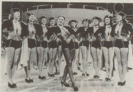
Abb. aus «Frauen-Brockhaus», Band A-Alma, zum Stichwort «Albanien»

Das «Trio Never Hoxa» gastiert zurzeit in der Schweiz. Laut Presstext sieht die Band nicht nur «saumässig gut aus, sondern gilt auch melodios vill gutt.» Die 18 Albanerinnen haben bereits um musikalisches Asyl nachgesucht.