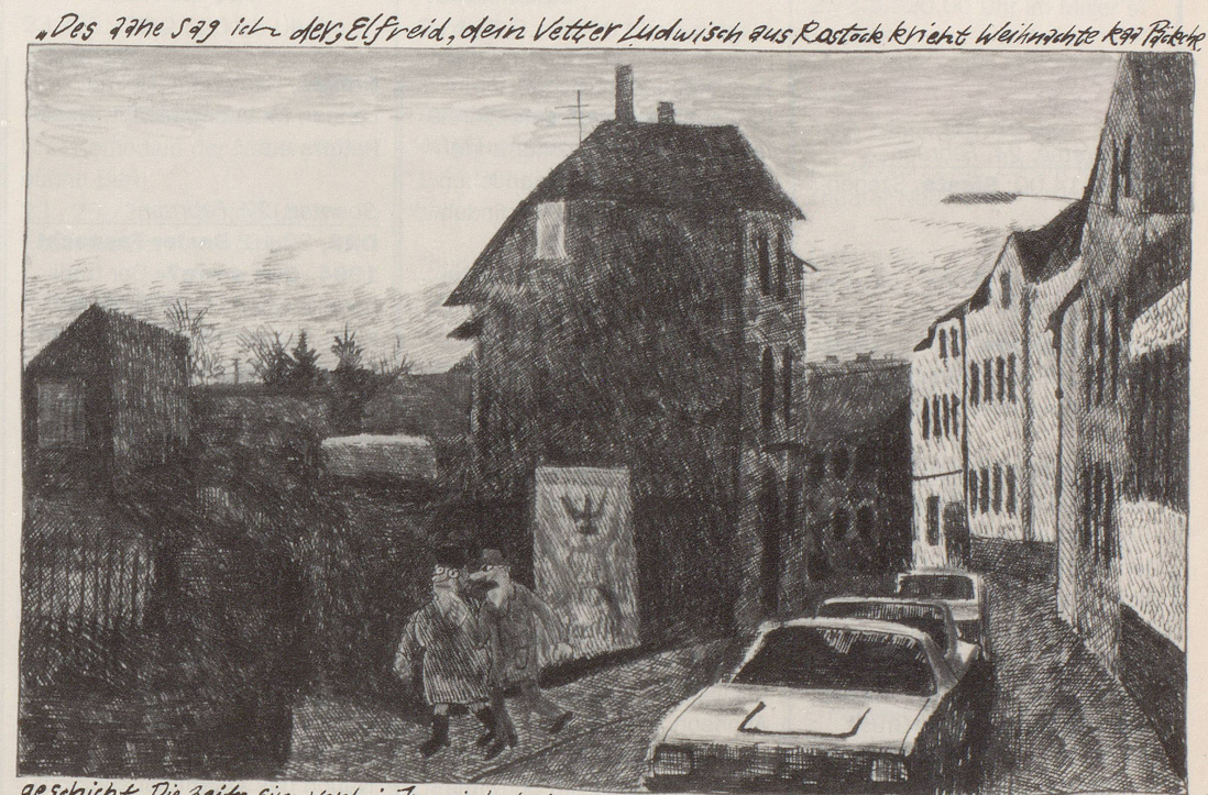
«Des 77ne sag ich der Elfried, dein Vetter Ludwig aus Rastade kriecht Weihnachte 1991 Pöckel»

Vergleichbar dem amerikanischen Underground-Comic-Zeichner Robert Crumb, leistet Chlodwig Poth seit den sechziger Jahren in seinen Karikaturen Gesellschaftskritik und -satire, indem er die unscheinbaren Details der Gesellschaft unter die Lupe nimmt. So sucht er auch in den «Sossenheim»-Stadtlandschaften ein untrüglisches Bild der Zeit und der Menschen nicht in profunden «Wahrheiten», sondern auf den Spuren alltäglicher Begebenheiten. «Wichtige» Ereignisse spiegeln