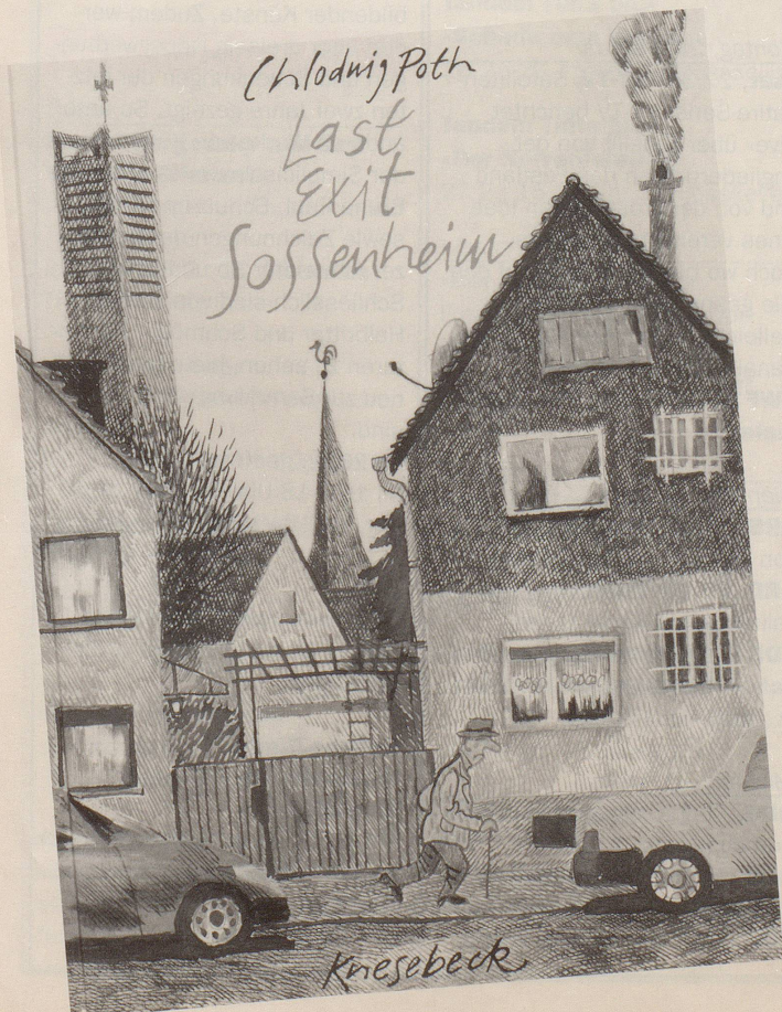
Chlodwig Poth Last Exit Sossenheim

Chlodwig Poth: Last Exit Sossenheim Knesebeck, München, ca. 144 Seiten, sFr. 49.40