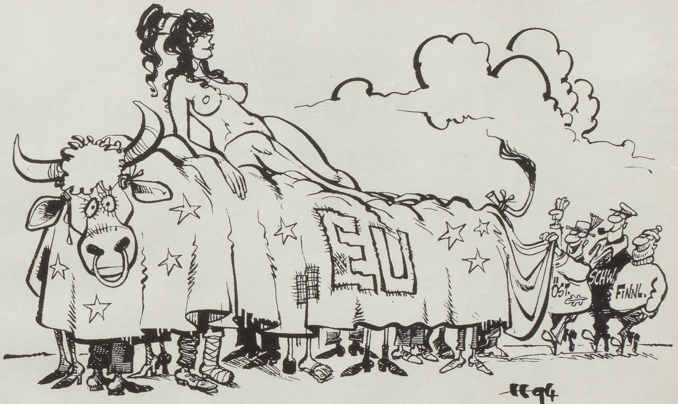
«Wir sind da, und weiter geht's im Gleichschritt!»