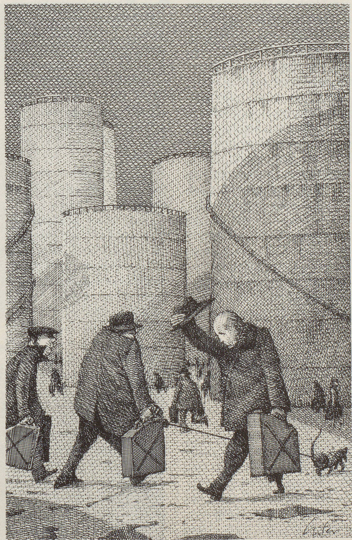
Schweizer Landschaft VII

D amit wären wir bei Vreni, die via Medien zum s'Vreni benannt worden ist. Swiss Vreni? Schneiders Vreni? Super Vreni? Nein nein, nur ein Helvetismus-Kürzel für: das Vreni. Da fällt mir ein, dass ich mal einen Walliser getroffen habe (nein, nicht Bodenmann), der war ein richtiger Klotz von Mann namens Urban, so um die 100 Kilo schwer und breit wie das Matterhorn aus ein Kilometer Entfernung. Sein Kollege, auch Walliser (Walliser haben nur im Wallis Kollegen, auf gar keinen Fall in der Üsserschwiiz. Ausnahme vielleicht: Bodenmann. Er zieht den Terminus «Genosse» anstelle von