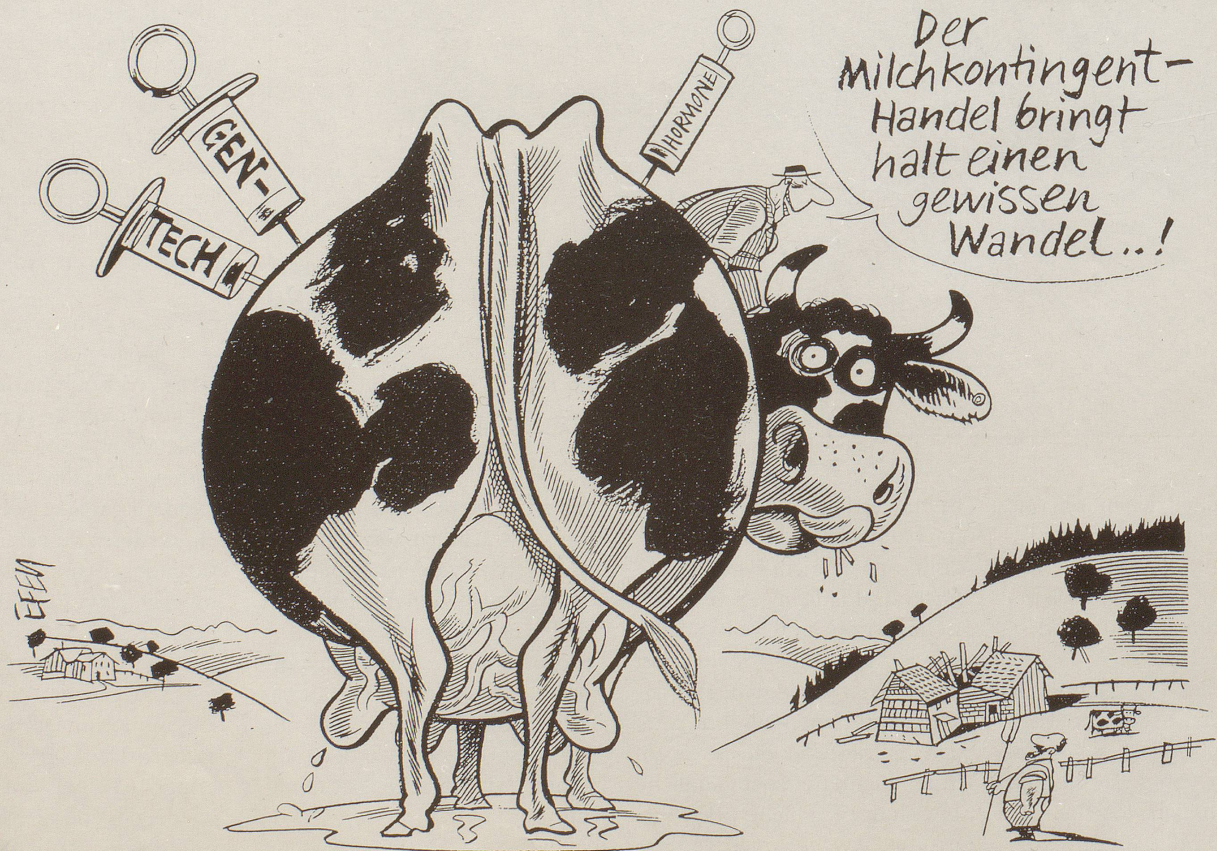
Bio- und Kleinbauern ergreifen das Referendum gegen den Milchkontingenthandel.