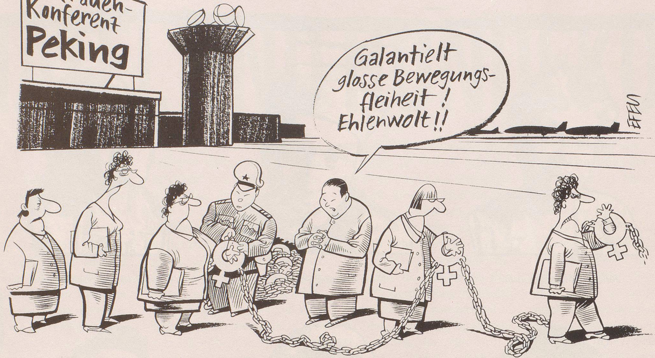
Mit leichten Behinderungen an der Weltfrauenkonferenz in China ist zu rechnen ...

Ganz einfach: Aus dem Kurzaufenthalt wird eine Langzeit- trennung!