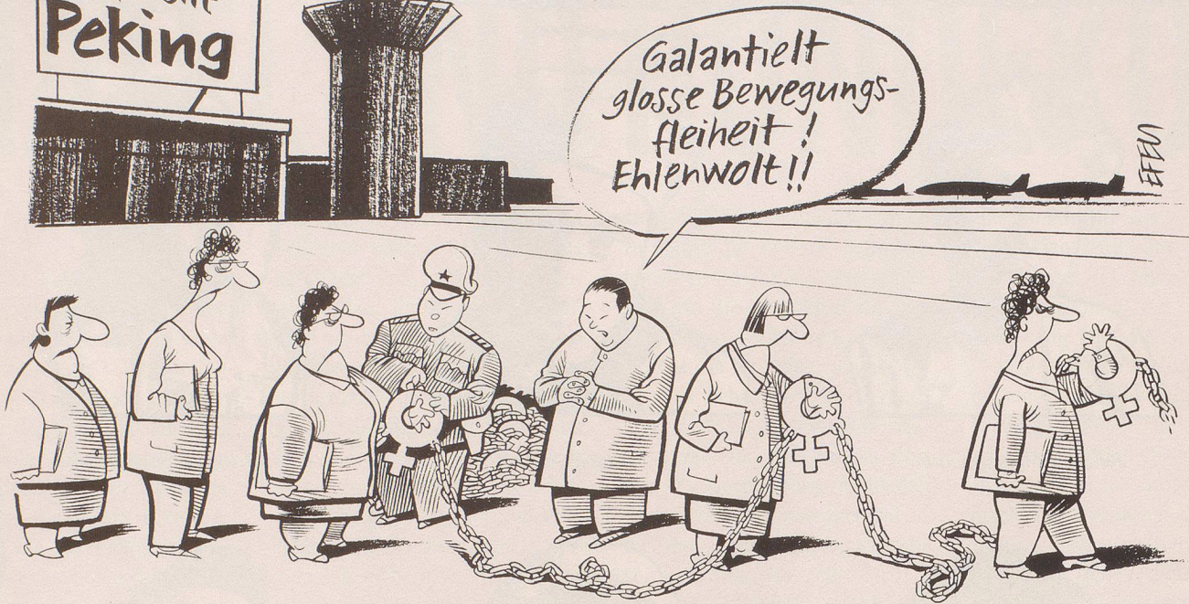
Mit leichten Behinderungen an der Weltfrauenkonferenz in China ist zu rechnen ...

Ganz einfach: Aus dem Kurzaufenthalt wird eine Langzeit- trennung!