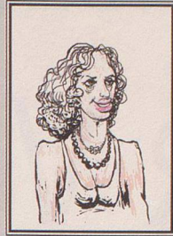
Brigitte von Hohenau

■ Brigitte von Hohenau – eine ehemalige Schauspielerin, die es nicht ertragen kann, dass ihre Schönheit weicht und ihr Busen erschlafft. Heckt tödliche Pläne aus, um ihre bildschöne Nichte Ursula um das Erbe der dreistöckigen Jugendstil-Vorstadtvilla zu bringen. Lässt sich von ihrem loyalen Chauffeur James im Bentley chauffieren und trägt aufwendige Jugendstil-Kleider.