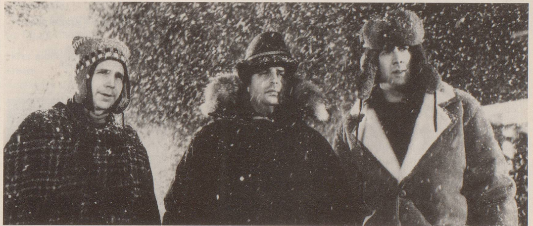
Viele Lacher pro Minute, eine reichlich banale Geschichte und viel Dummheit: stürmisch, stürmisch!

Die einzige Figur des Films, die nicht lieb ist, ein alter Killer, der aus dem Gefängnis ausbricht, wird vor der rührenden Schlusszene, in der alle sich versöhnen, einfach weggebracht. Vielleicht könnte er als Haupttäter den FBI-Agenten erklären, was genau geschehen ist. Aber selbst FBI-Leuten scheint mehr an der Harmonie von Schlusszenen als an der Aufklärung von Verbrechen zu liegen.