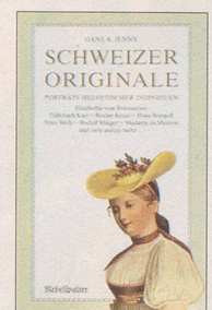
Hans A. Jenny Schweizer Originale Erster Band Porträts helvetischer Individuen, 120 S., Fr. 14.80, 3. Auflage