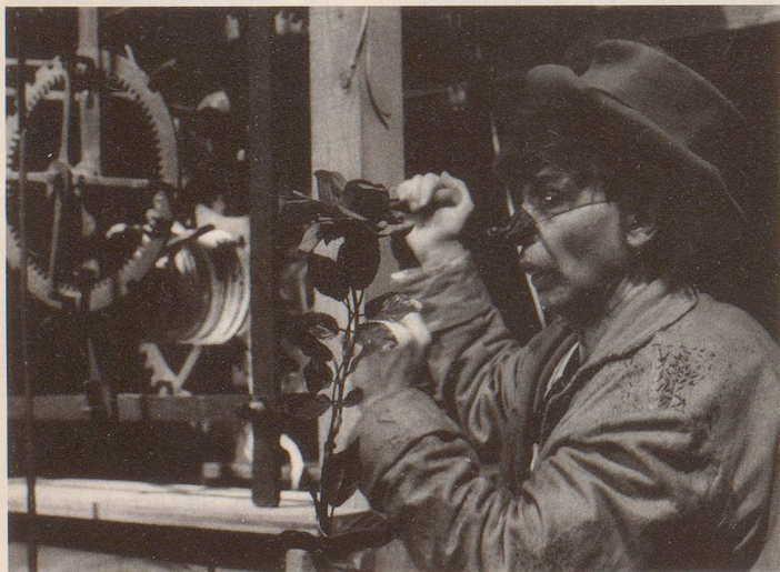
... und mit surrealen, gruseligen Anflügen: Herbstzeitrose.

traf er den Wächter der Zeit. Mit ihm, Groll de Terre, verbrachte Grim viele Stunden auf dem Uhrturm. Schwatzend und palavernd. Von hier aus mass Groll de Terre jedem Erdenbewohner seine Zeit zu, und jedesmal zum Stundenschlag fuhr das Gewicht der Uhr in die Tiefe und erschüt-