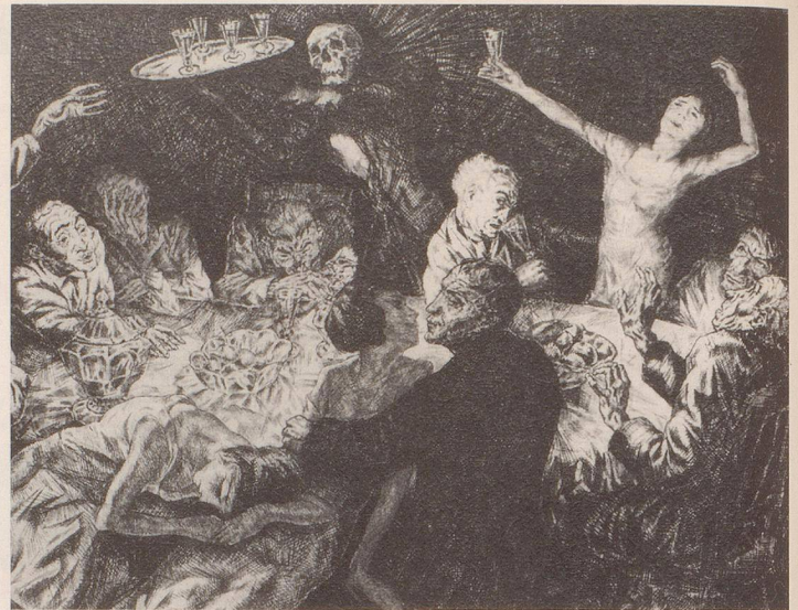
Tafelrunde und Tod 1918, Radierung