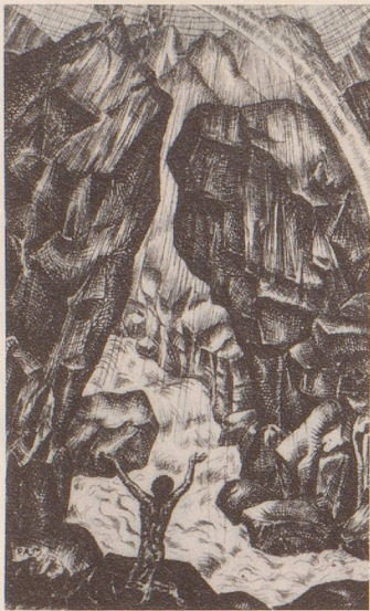
Ex Libris 1919, Radierung

Vater erscheint und Geige spielt. Die Mutter erzählt dem Jungen daraufhin, dass sein Vater nach der Arbeit zu Hause zuallererst auf der Geige alte Weisen gespielt habe.