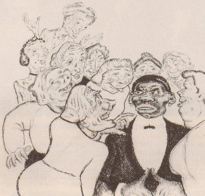
Was kann denn dieser Moor dafür, dass er weiss nicht ist wie ihr? Entwurf für den Nebelspalter , nach 1945, Feder in Tusche

Nein, seine Bilder waren keineswegs humorvoll oder gemütlich.