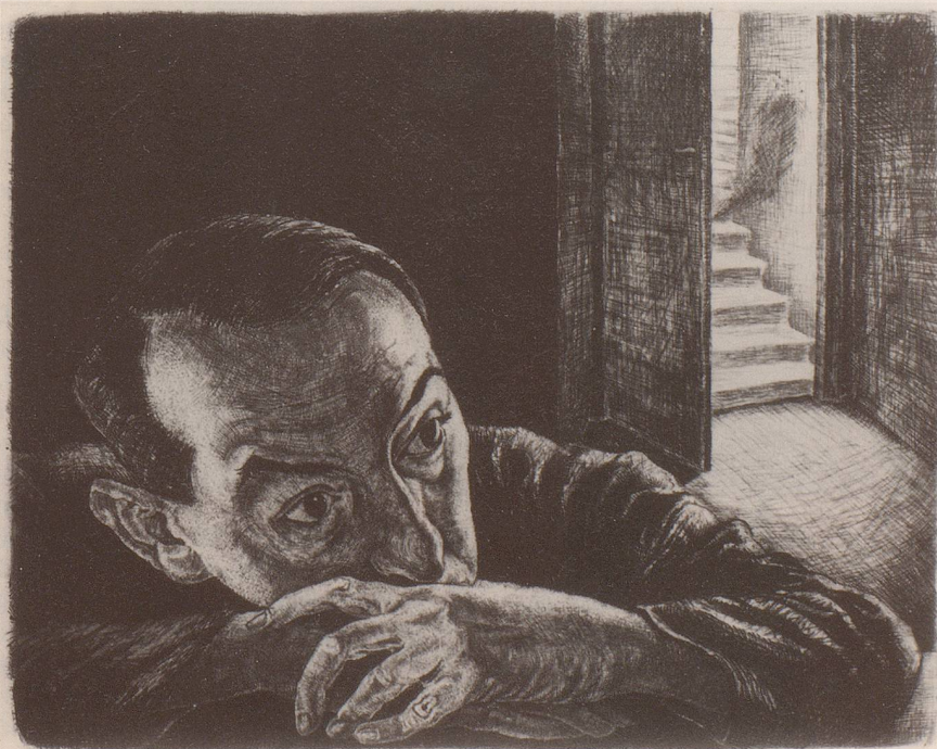
Das Problem (Selbstportrait) um 1920, Radierung

ren. Kaum ist er zwei Jahre alt, stirbt der Vater, stirbt die jüngere Schwester. Dieser Riss geht tief. Rabinovitch schreibt in seinen «Erinnerungen aus Kindheit und Jugend», dass er selbst als Gymnasiast noch diesen einen, diesen immer wiederkehrenden Traum durchlebt, worin der erste