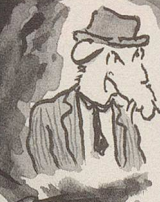
Jgori, der Mann mit dem Schweizer Akzent