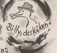
Billy, das Kücken