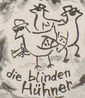
die blinden Hühner

Vielleicht würde er sie alle eines Tages wiedersehen...? Wer weiß???