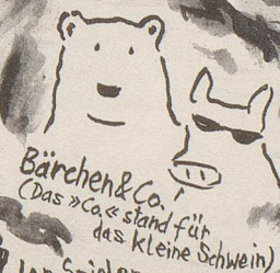
Bärchen & Co. (Das »Co.« stand für das kleine Schwein)