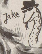
Jake the Snake