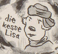
die kessre Lisa