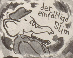
der einfältige Slim