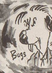
Bugs Nagezähne Jenkins