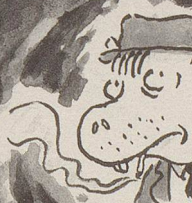
der berühmte Privatdetektiv Snuffy, in dessen Agentur Sam seine Auszubildung machte