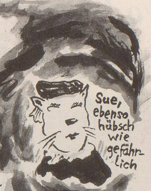
Sue, ebenso hübsch wie gefährlich