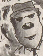
der Spieler Van Cool