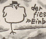
der fiere »Einbein«