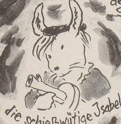
die schießwütige Isabell