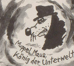
Moppel Maus, König der Unterwelt