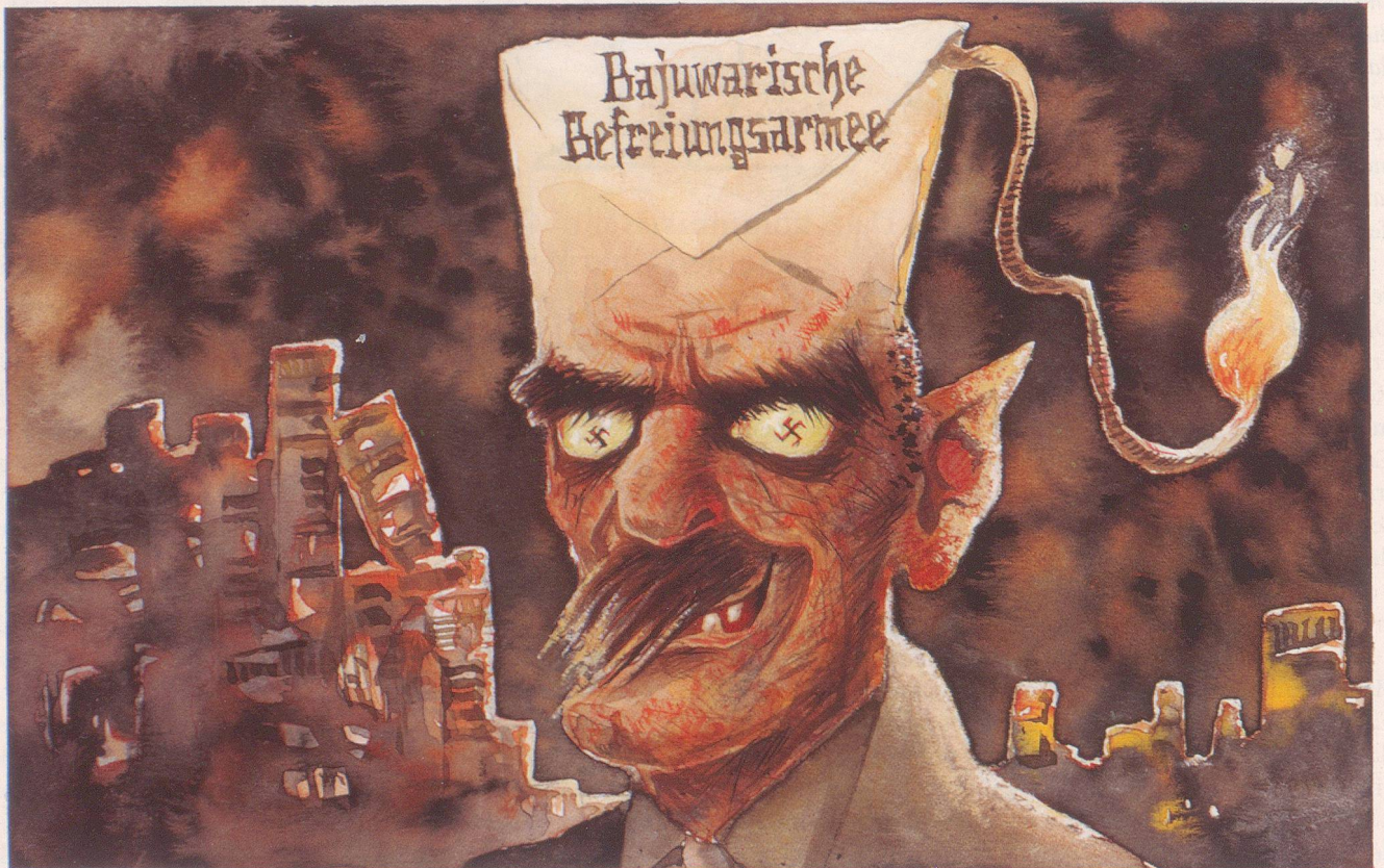
...and Mr. Hyde