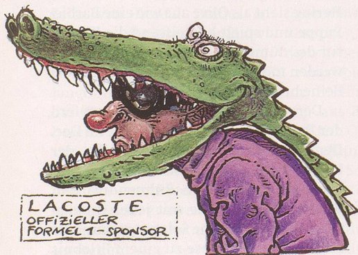
LACOSTE OFFIZIELLER FORMEL 1-SPONSOR

Firmenlogo die heuchlerischen Vorschriften verletzt. Sobald wir soweit sind, das Fernsehen mit dem Fernsehen zu verbinden, werden unsere Ski-Asse penetrant nach Emmentaler riechen, obwohl Befürchtungen berechtigt sind, dass es die Schweizerische Käseunion dann nicht mehr gibt.