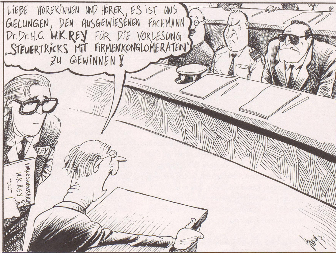
Neue Fachhochschule für Wirtschaftskriminalität, irgendwann im Jahre 2005.