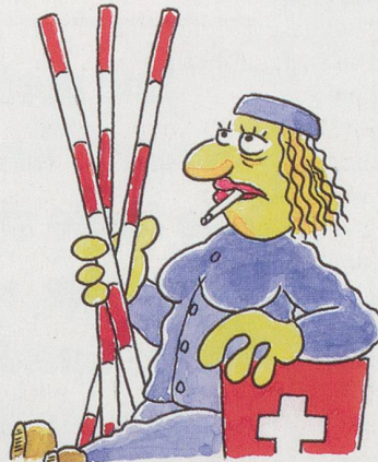
... Neuenburg: "Natur und Künstlichkeit". Künstliche Schilf= halme werden zu authentischen Strassenmarkierungsstangen.

Vom Computer errechnete, etwas kosten= günstigere Synthese aller.