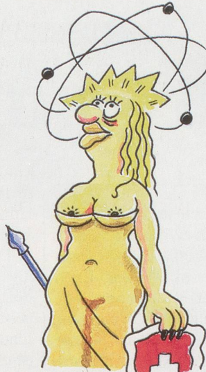
... Yverdon: sinnliches "Ich und das Universum"