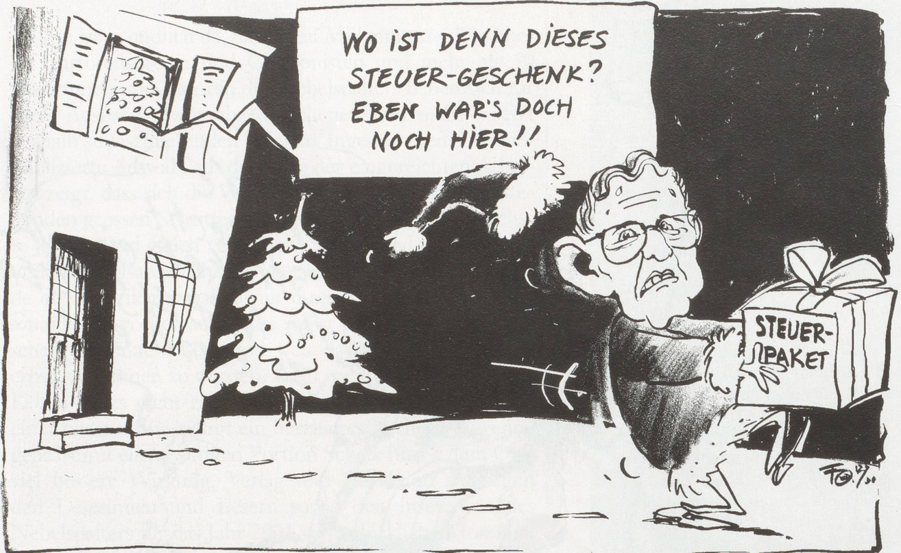
Doch nicht billiger wird's für Familien und Wohneigentümer, dank Villiger.