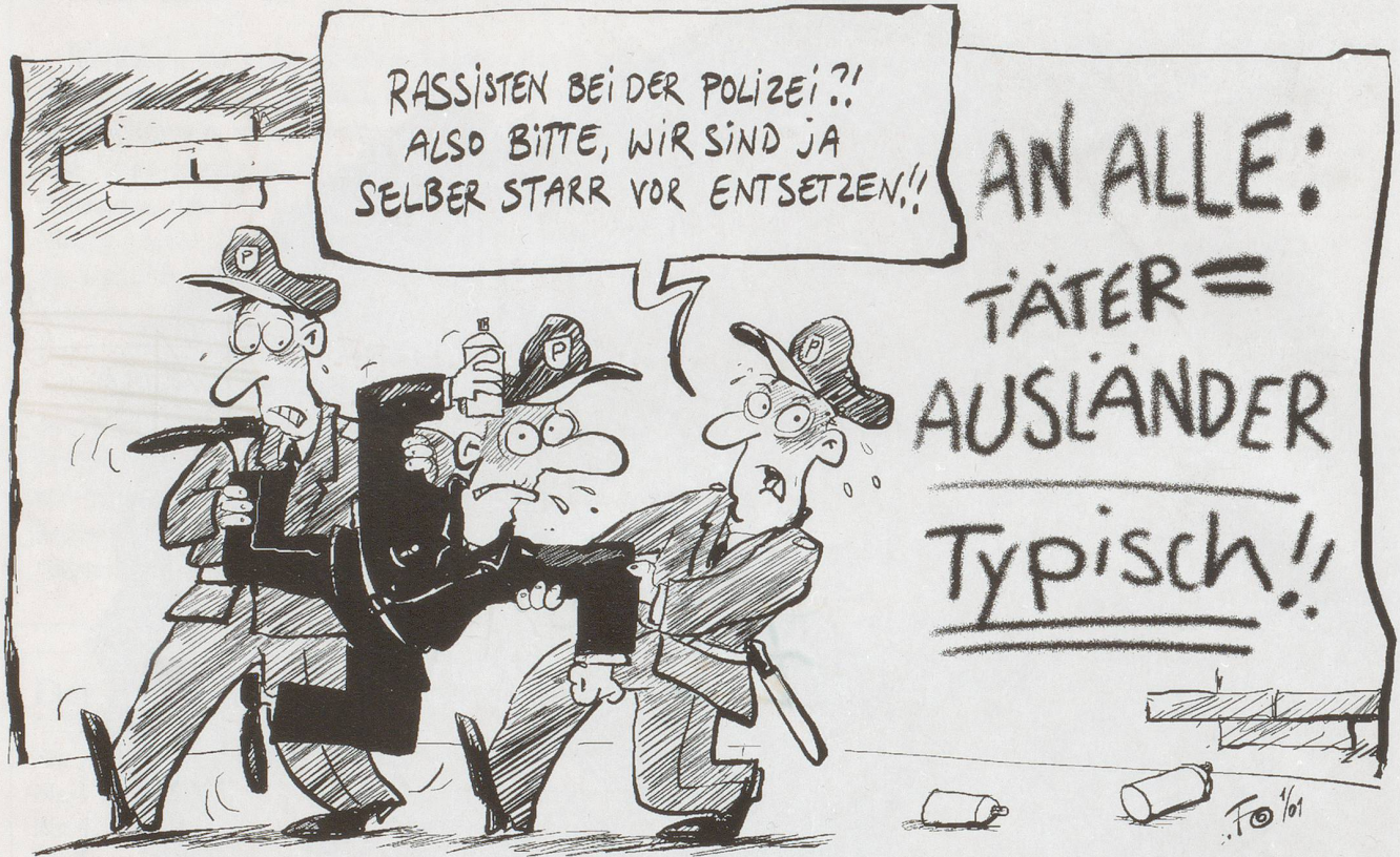
Fehlleistung: Die Turgauer Kantonspolizei hat an ihrer rassistischen Pressemitteilung schwer zu tragen...