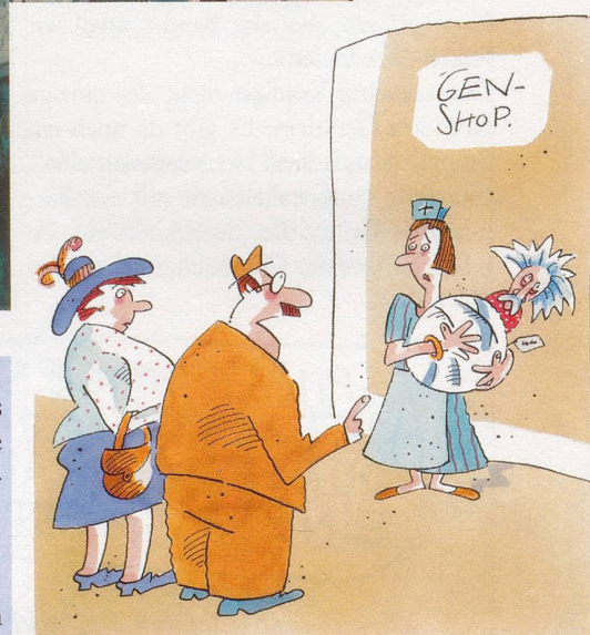
„Um Gottes Willen; Einstein haben schon unsere Nachbarn!“

Wenn Gott Vater mit einer Zange genüsslich die letzten Autos in sein blaues Netz sammelt oder die entsetzten Eltern im Gen-Shop feststellen müssen, dass die Nachbarn auch schon ein Einstein-Baby haben, kann es sich – mancher Zeitgenosse mag erleichtert aufatmen – nur um Karikaturen und Cartoons handeln.