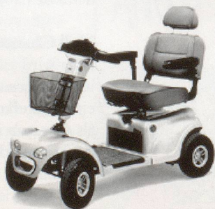
Modell 889-XLS Deluxe

Verlangen Sie Ihr unverbindliches Angebot Degonda-Rehab SA