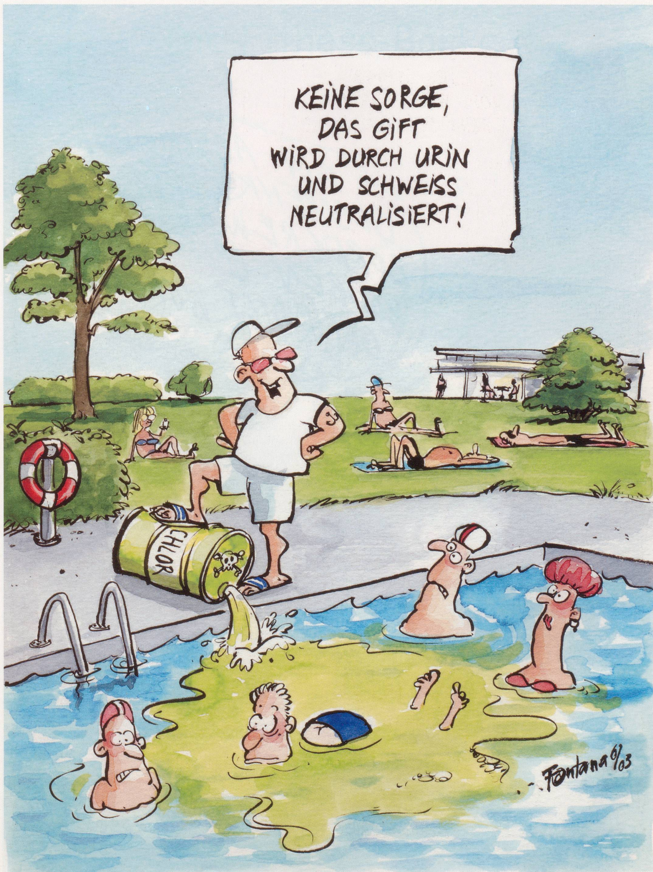
Spass im Nass: Das Wasser in Gartenbädern ist oft durch Bakterien, Urin und Fäkalien belastet – oder durch zuviel Chemie.