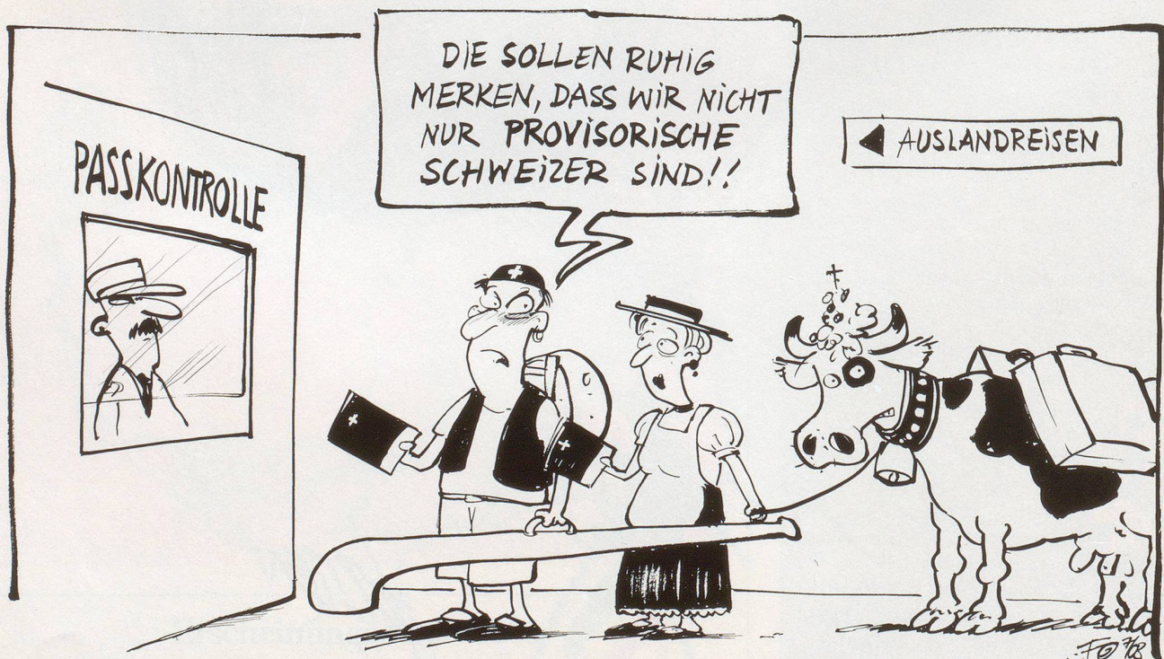
Kein (S)Pass ... Wegen grosser Probleme bei der Auslieferung der neuen Schweizerpässe, reisen viele Schweizer mit provisorischen Papieren in die Ferien.