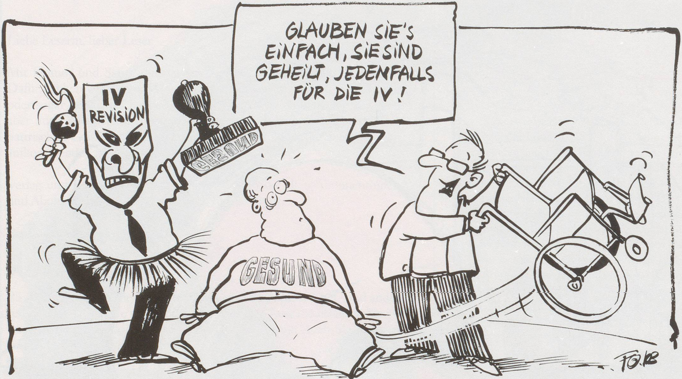
Geistheilung? Um die Versicherung zu entlasten, soll Invalidität restriktiver definiert werden. Viele Halbinvalide werden künftig gesund sein.