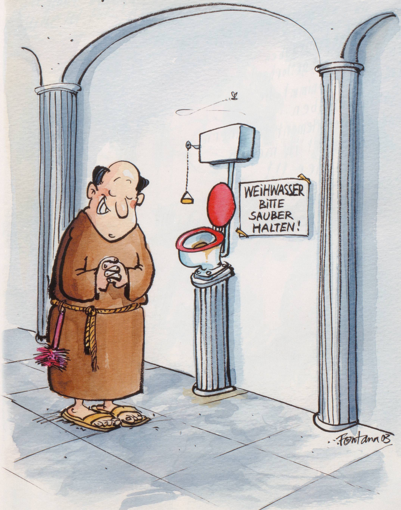
Geistliche Hygiene: Das Weihwasser im Kloster Einsiedeln ist bakterienverseucht. Ein Aktionsplan soll das heilige Nass sauber machen.