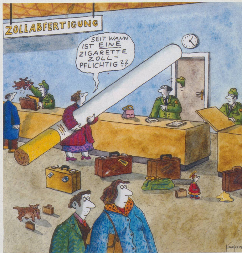
MANFRED VON PAPPEN