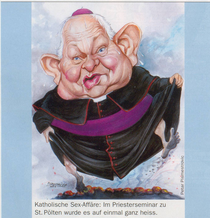
Katholische Sex-Affäre: Im Priesterseminar zu St. Pölten wurde es auf einmal ganz heiss.

PS: In der nächsten Ausgabe werfen wir einen Blick auf die bevorstehenden Präsidentschaftswahlen in den USA und lüften das Geheimnis, wie Amerika nach den Wahlen aussehen wird. Nichts für schwache Nerven.