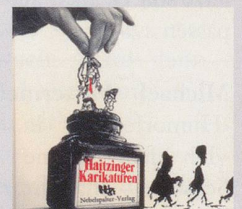
1981 Fr. 19.80