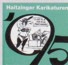
1995 Fr. 19.80