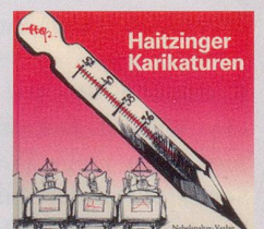
1992 Fr. 19.80