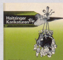
1991 Fr. 19.80