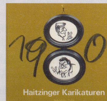
1980 Fr. 19.80