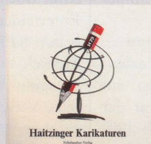
1979 Fr. 19.80