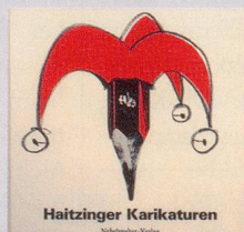
1983 Fr. 19.80