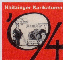
1994 Fr. 19.80