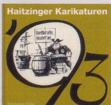
1993 Fr. 19.80