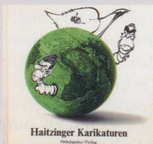
1982 Fr. 19.80