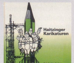
1987 Fr. 19.80