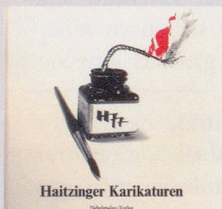
1977 Fr. 19.80

Diese und mehr als 100 weitere «Nebenspalter»-Publikationen können mittels Bestellkarte im «Nebibuchshop» unter www.nebenspalter.ch oder über den Abodienst (Tel. 071 846 88 76) bezogen werden.