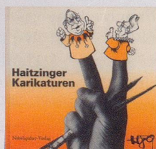
1989 Fr. 19.80