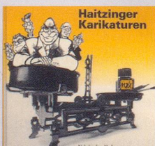
1988 Fr. 19.80