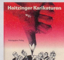
1986 Fr. 19.80