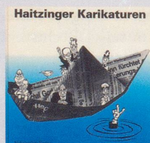
1990 Fr. 19.80