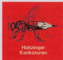
1978 Fr. 19.80