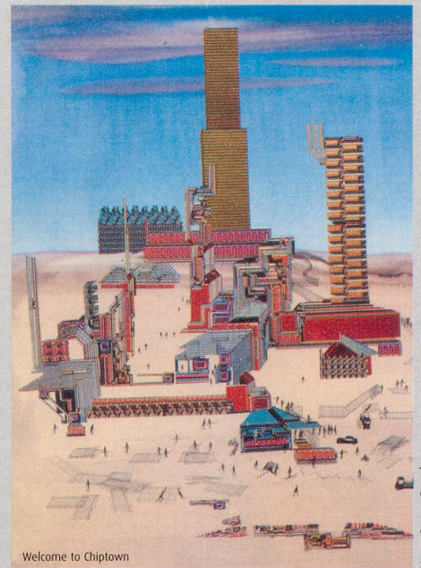
Welcome to Chiptown

würden wir noch zusammen reden und dem Vis-à-vis nicht Mails schicken. Dann wüssten wir nicht, was gerade in Neuseeland geschieht. Dann hätten wir noch Kontakt zu Leuten ohne E-Mail-Adresse. Dann stünden die Lexikas in der Nähe des Schreibtisches statt im Keller. Dann würden wir wieder frühstücken, bevor wir Post erhalten. Dann könnten wir mit dem Briefträger noch Kaffee trinken – und mehr! Dann gäbe es also keine Geburtenrückgänge. Und nicht nur dank dem Briefträger: Dann würden neue, potenzielle Seitensprung-Bekanntschafungen nicht zuerst skeptisch gegoogelt. Dann bräuchten wir wieder richtige Jasskarten für Solitär. Und eben: Vielleicht gäbe es Modern Talking noch. Doch nicht so schlecht, das Regime des WWW.