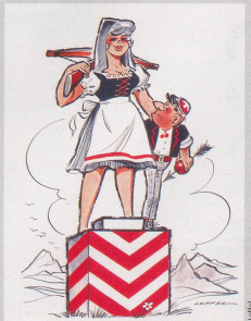
Inmer mehr Schweizerinnen werden Kantonsrätin und Kantonsrätin.