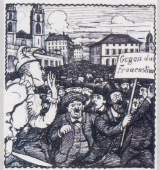
Nebelgaller: «Mit keiner Aufregung, weisse Herend! Ich handelt sich nur um eine Formsache. Unsere Gesetze machen ja ohnehin die Frauenweiser.»