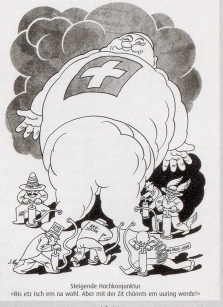
Stehende Hochkonjunktur «Es ist sich ein zu wollen. Aber mit der Zeit kommt es unangenehm werden» 1961

Besseres anzufangen, als sich zu emanzipieren. Auf den Nierentisch und die Feuerzangenbowle blickt man nun herab, als wären sie Ausdruck der überlsten Biedermeierei. Die meisten Ikonen der Zeit sind relativ früh und oftmals tragisch von der Weltbühne abgegangen. Das Wort Hochkonjunktur ist zwar auch heutzutage in aller Munde, aber keiner glaubt mehr so richtig an Ihre Machbarkeit. Nur einer hat, beinahe wie ein Fossil, die Epoche überlebt, der einsame alte Mann in Havanna, Fidel Castro. Dort soll es auch noch ein wenig wie in den fünfziger Jahren aussehen, nur fehlen der Glanz und Optimismus. Castro hatte auch nie was mit freiem Markt und Wirtschaftswunder im Sinn, sich vermutlich auch nie gefragt, was Frauen wünschen. Er, der sich als ungeschickter, aber zäher Revolutionär und zaudernder Ideologe einen Namen gemacht hat, führt nun ein spartanisches Leben und hält manchmal noch fünfständige Reden, die er nach wie vor mit dem Pathos des Kalten Krieges vorzutragen pflegt, was einige seiner Zuhörer aber nicht vor dem Einschlafen bewahrt.