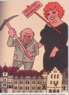
Hochreguliert und Spekulation, die Schäden der alten, schönen Stadtkerne. 1961