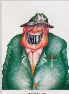
Zeitgeistliches Lachen 1989