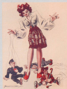
Der vom Himmel gefallene Amerikaner, nun reicher als Kaiser!