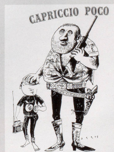
1918 oder «Die Überbrückung durch italienische Gabelstapler»