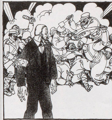
«Potz Chaib! – Wann ich da nu am End nüd au na muess mitmache!»