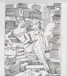
1905 Der Papiermenschen der Bundesverwaltung bringt im vergangenen Jahr 1905 keinen, das sind 150 Tausend mehr als im Vorjahr. «Macht mer so den Hüpfen» - «Der Herr, der im Vorjahr, hat sich ein Stück Papier-Schäperei» - «Der Papiermenschen der Bundesverwaltung bringt im vergangenen Jahr 1905 keinen, das sind 150 Tausend mehr als im Vorjahr» - «Macht mer so den Hüpfen» - «Der Herr, der im Vorjahr, hat sich ein Stück Papier-Schäperei» - «Der Herr, der im Vorjahr, hat sich ein Stück Papier-Schäperei»

1895 Kriegs Franzos ist hundert Jahre später ein Linsen, der im Welt- nachweislich nicht mehr vegründet- lens ist.